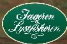
Gateway Sportman Str. 41-48 - Pris 999,05,-

MAREN TURIS GADE 8, 8000 AALBORG - TLF. 9913 9400 - WWW.JOGL.DK