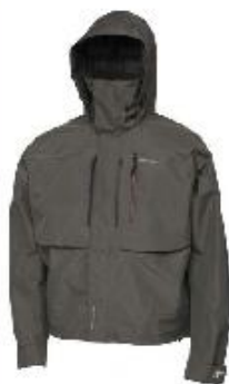
Sierra Fusiontech Vadejakke Før 1799,- Nu kun 799,-