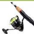
Daiwa Ninja Spinnesæt Før 1299,- Nu kun 899,-